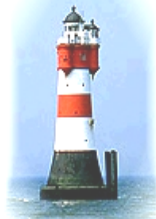
Leuchtturm Roter Sand