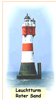
Leuchtturm Roter Sand